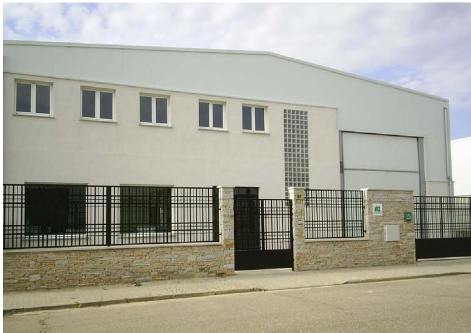
Instalaciones ubicadas en el Polígono Industrial de los Llanos

Actualmente estamos ubicados en el Polígono Industrial de Los Llanos en una nave industrial de 744 m 2 , provista de unas oficinas de 288 m 2 , equipadas con las últimas tecnologías en Sistemas de Información. Disponemos de una red 10/100/1000 Mbps con capacidad para más de 100 puestos de trabajo, con varios servidores Windows y Linux, cámaras IP, control de presencia, etc.